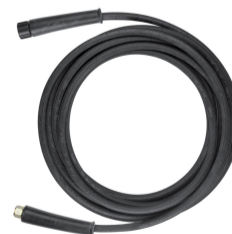
TUBO ARMATO ALTA PRESSIONE (10 M) 3160170