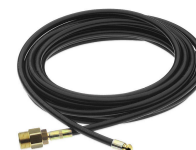
KIT PULIZIA TUBAZIONI (8 M) 46365