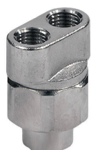
TESTINA DOPPIO UGELLO 3025