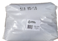
SABBIA CALIBRATA E FILTRATA (25 KG) 41770