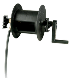
KIT RLW SENZA TUBO 40840