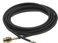
KIT PULIZIA TUBAZIONI (16 M) 46367