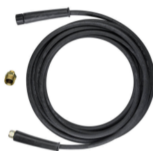
PROLUNGA TUBO ARMATO ALTA PRESSIONE (15 M) 40106